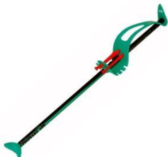
Sarbacanes Sarbacanes, cibles