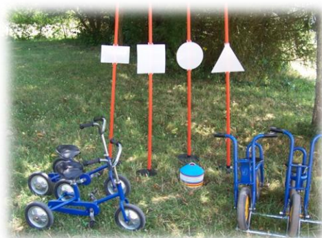
Kit Parcours Ludique (sur mesure) Composition sur demande :