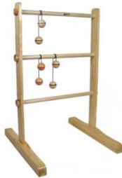
Lancer de Tac