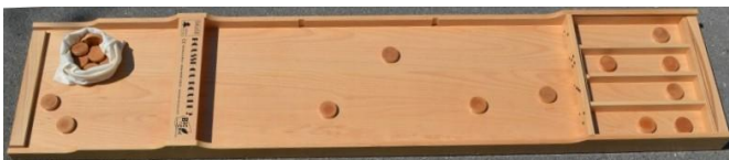
Pousse ou roule