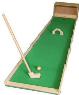
Piste de golf / bowling modulable